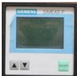
SICAM P50 (vorne)

... über ein Universalmessgerät vom Typ „Power-Meter SICAM P“ zur Anbindung an bauseits vorhandene Spannungs- und Stromwandler: