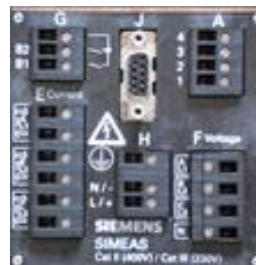
SICAM P 50 (hinten)

Für die Störmeldung des SICAM P ist der Binärausgang 1 „B1“ (Klemme G3) und die entsprechende Basis (Klemme G1) am SICAM P zu verwenden.