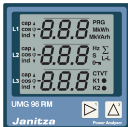
UMG 96RM-E (vorne)

... über ein Universalmessgerät vom Typ „Janitza UMG 96RM-E“ zur Anbindung an bauseits vorhandene Spannungs- und Stromwandler: