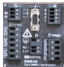
SICAM P 50 (hinten)

Für die Störmeldung des SICAM P ist der Binärausgang 1 „B1“ (Klemme G3) und die entsprechende Basis (Klemme G1) am SICAM P zu verwenden.