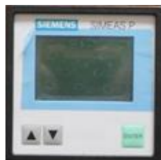
SICAM P50 (vorne)

... über ein Universalmessgerät vom Typ „Power-Meter SICAM P“ zur Anbindung an bestehende Spannungs- und Stromwandler: